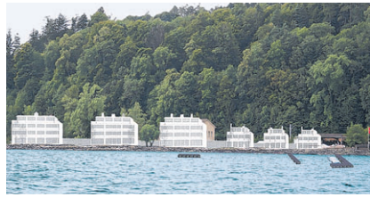
Zur Erinnerung: So soll die Naturlandschaft auf dem Ziegelhof in Zukunft aussehen.

Im Baudepartement St. Gallen will man die Besitzverhältnisse zum Ziegelhof klären. Doch die Verträge sind klar. Und Bauherr Beat Jud nahm Stellung. Die Fakten aber erhärten sich: Es wird Seeland aufgefüllt.