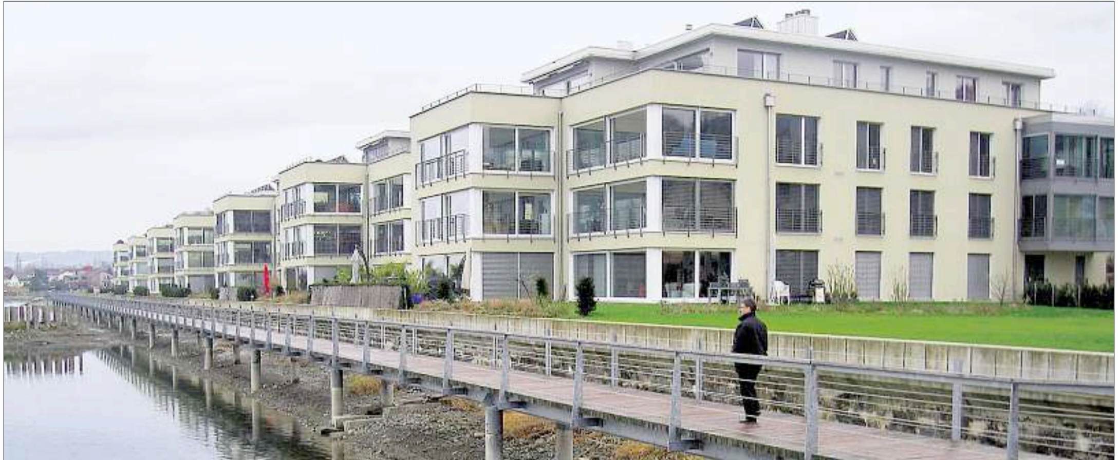
Die Bodenseegemeinde Thal hat direkt am Ufer auf öffentlichem Seegebiet einen Fussgängersteg erstellt. Die Bevölkerung freuts – die Bewohner der dahinter liegenden Siedlung weniger. Dass der Steg nun verlängert werden soll, sorgt für böses Blut.

Zürichseeuferweg Diskussion über öffentlichen Seezugang auch an anderen Seen